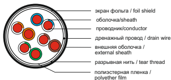
Рисунок 2 – конструкция кабеля типа F/UTP / Figure 2 – F/UTP type cable design